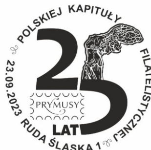
Drugi dzień wystawy, obchody 25-lecia Polskiej Kapituły Filatelistycznej Statuetki „Prymus”