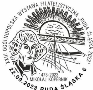
Datownik z dnia otwarcia wystawy