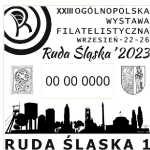
Datownik ozdobny ze zmienną datą, stosowany od 02.01.2023 r.